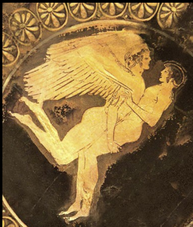
Зефир и Гиацинт. Последний был героем гомосексуалов Спарты. Краснофигурный кубок из Тарквинии, гр. 490 г. до н.э.

Есть Демоны, которые приходят к людям Третьего пола и людям с Двойной Душой / Душам-Близнецам для вечной любви. Есть Демоны, которые хотят прийти к тем, кто способны оценить их благородную и прекрасную натуру и вечную нежную любовь. Они умеют ценить нашу преданность. Они не бросаются человеческими сердцами.